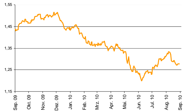
Wechselkurs USD/EUR Zeitraum: 1 Jahr

die Entscheidung, den Ausstieg aus der sehr expansiven Geldpolitik zu unterbrechen. Zwar geht die Federal Reserve davon aus, dass sich die konjunkturelle Erholung fortsetzen wird, doch rechnen die Notenbanker damit, dass der Aufschwung in der nächsten Zeit weniger dynamisch ausfällt als ursprünglich erwartet. Doch die mit allen diesen Meldungen einhergehende Verunsicherung der Marktteilnehmer geht im Verhältnis von Euro zum Dollar nur zu Lasten der europäischen Einheitswährung. Was Amerikas Landeswährung hilft, ist der traditionelle Status als Hort der Sicherheit. Wobei beim Blick auf die hohen Schuldenberge in Amerika fraglich ist, ob dieser Status überhaupt noch gerechtfertigt ist. Aber bereits auf dem Höhepunkt der jüngsten Euro-Krise hatte der Dollar zum Euro oft auch dann zugelegt, wenn sich die Konjunktur in Amerika ebenfalls schlecht präsentierte.